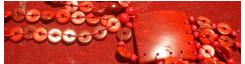
Collier coco rouge