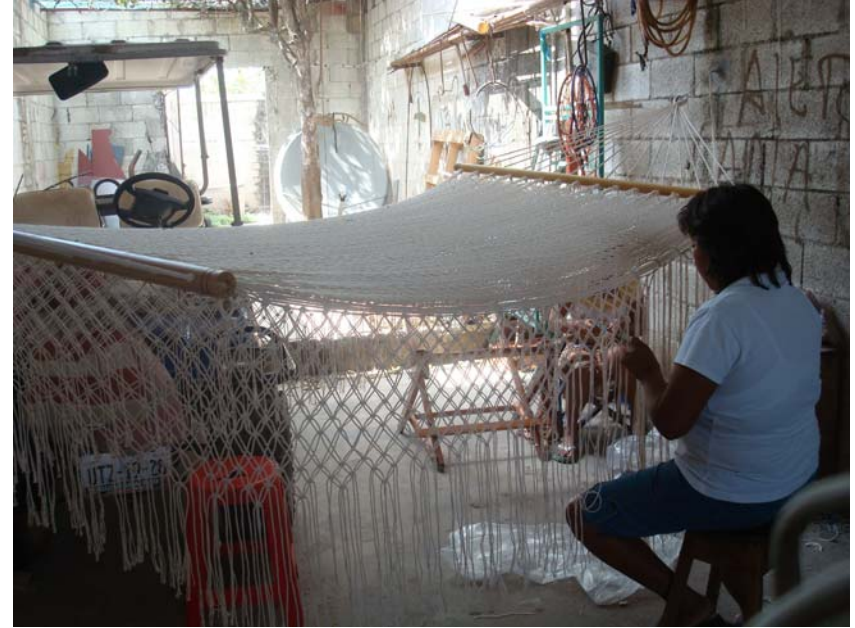
Travail fait à la main