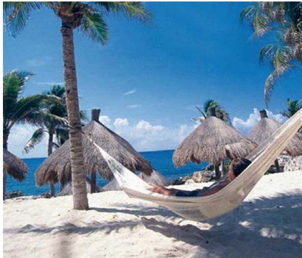
Hamac Chichen Itza